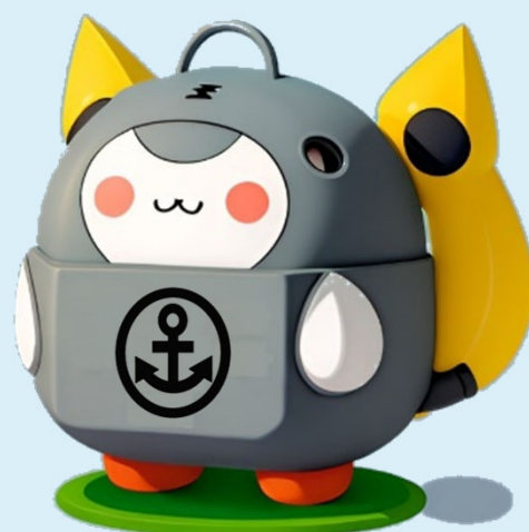
DEFENSEイメージキャラ 「まもちゃん」