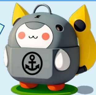
DEFENSEイメージキャラ 「まもちゃん」