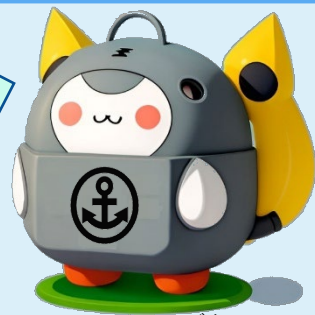
DEFENSEイメージキャラ 「まもちゃん」