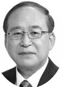
市民連合のみやぎ推薦 日本共産党