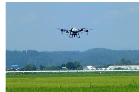
農薬散布作業の様子