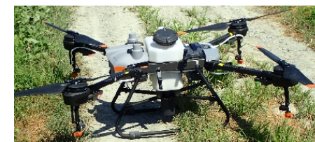
導入したドローン