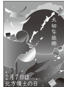
2022年度 最優秀賞(高校の部)