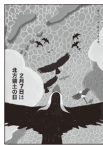
2022年度 最優秀賞(大学・専門学校の部)