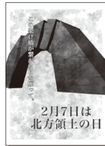
2022年度 優秀賞(高校の部)