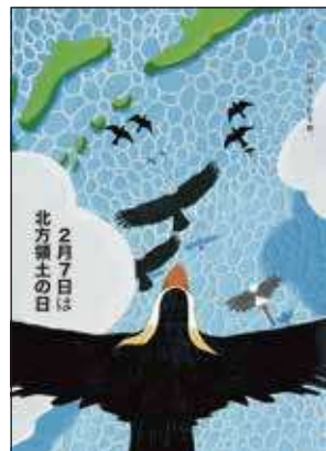
2022年度 最優秀賞 (大学・専門学校の部)