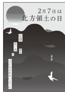
2022年度 優秀賞(大学・専門学校の部)

北海道デザイン協議会は、個人、産業、地域、社会、そしてよりグローバルな領域におけるデザイン活動の向上と活性化をめざし、北海道のデザインの可能性を信ずる人々の力を結集し、多様なデザイン活動を通じて社会への提案と啓蒙活動を展開する団体です。 詳しくは、ホームページをご覧ください。 http://www.hda21.jp/