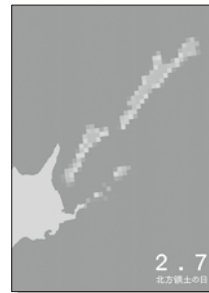
2022年度 優秀賞(一般の部)