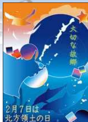
2022年度 最優秀賞（高校の部）