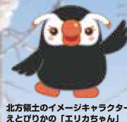
北方領土のイメージキャラクター えとびりかの「エリカちゃん」