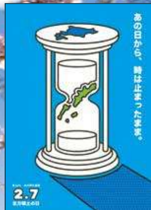
2022年度 最優秀賞（総合）