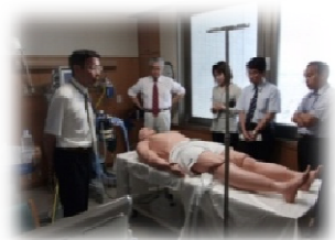
症例シミュレータ

※第1回研究会では，東北大学病院スキルズラボの見学実習を開催。5つの臨床実習用のラボブースをグループごとに見学し，高度な医療シミュレータや手術機材等を体験。