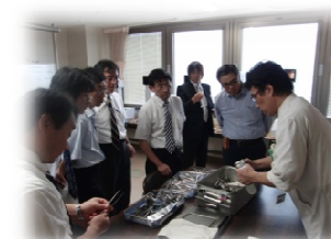
エチコンエンドサージェリー 器具類