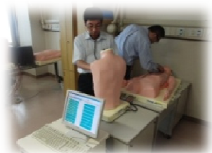
心音の聴取や脈拍の触知