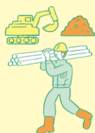
工務部門 (現場監督、工事現場の責任者)