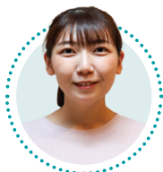
K・Kさん 出身校: 本吉響高校 入社8年目

高校卒業後すぐに入職し、右も左も分からない状態でしたが、先輩職員から教わりながら介護を行っていくうちに、出来る事が増えていき、その度に利用者様が喜んでくださることが嬉しく、より利用者様に喜んでいただけるよう、仕事の範囲を広げたいと思うようになりました。現在は生活相談員と介護福祉士の仕事を行っており、利用者様だけではなく、ご家族様や地域の皆様とも関わる機会が増えたことでよりやりがいを感じています。