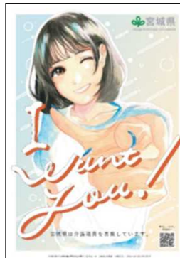
介護ポスター配布