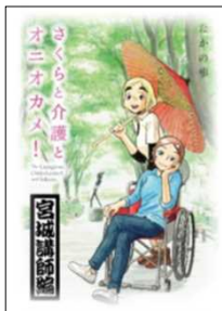
中高生向けリーフレット配布