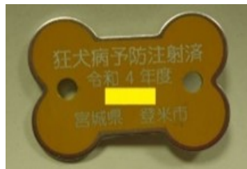
登米市の鑑札・注射済票