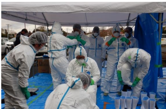
令和4年度豚熱防疫演習の様子

登米市は、とりわけ畜産の盛んな地域であり県内でも有数の大規模農家が多くあります。疾病によっては、ひとたび発生すると清浄化に数年以上かかる場合もあり経済的損失も多大となることから、関係機関一体となり全力で事業推進に取り組んでまいります。