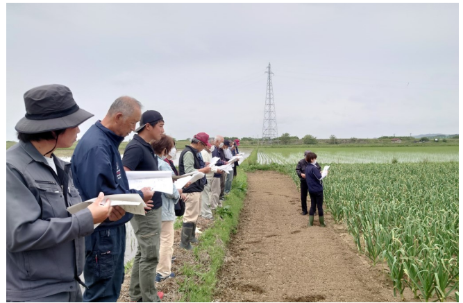
にんにく部会現地検討会