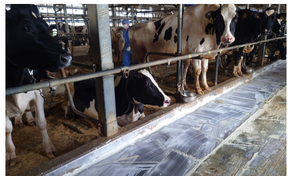
酪農家での牛床消毒