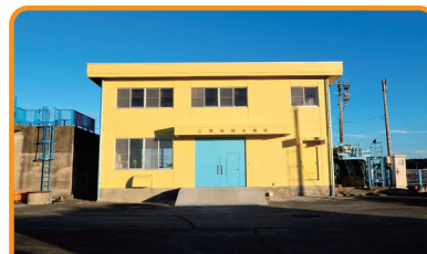
水利施設等保全高度化事業(基幹水利施設保全身) 二間堀地区

ダム・頭首工・用排水機場・幹線用排水路等、基幹的な農業用排水施設の整備を行い、用水不足の解消や水害防止をはじめとした水利用の安定と合理化により、農業生産性の安定を図るものです。