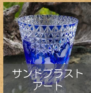
サンドブラストアート