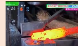
手打ち刃物： KKT熊本県民テレビ