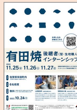
後継者インターンシップ 佐賀県有田町