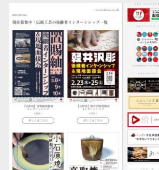
インターンシップ特設WEB

Google検索「 職人 日本 」「 伝統工芸 後継者 」等で 1位表示 、ニッポン手仕事図鑑のWEBサイト内で集客します！