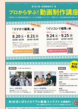
動画制作講座 滋賀県米原市