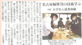
名古屋桐箆筒