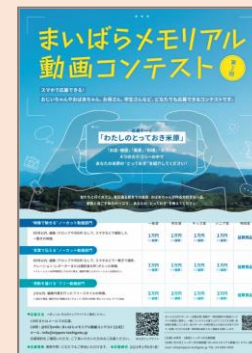
動画コンテスト 滋賀県米原市