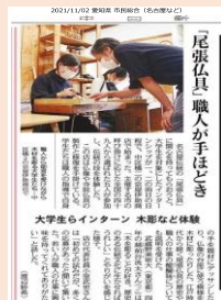
名古屋桐箆筒： 中日新聞