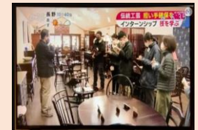
松本家具： SBC信越放送