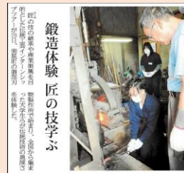
手打ち刃物