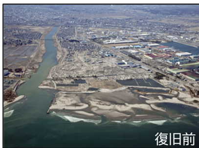
○七北田川（仙台市宮城野区蒲生）