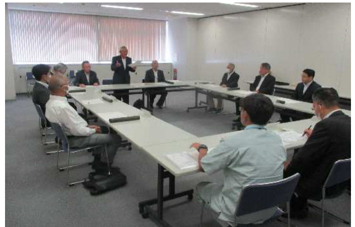
受賞者（ロード）による情報交換