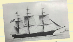
ハワイ移民船・サイオト号

江戸時代が終わり、世の中が混乱していたころ、多くの日本人が仕事を求めてハワイに移り住みましたが、きびしい仕事をさせられるなどの差別を受けました。牧野富三郎は、ハワイで働く日本人の生活をよりよいものにするために活躍しました。