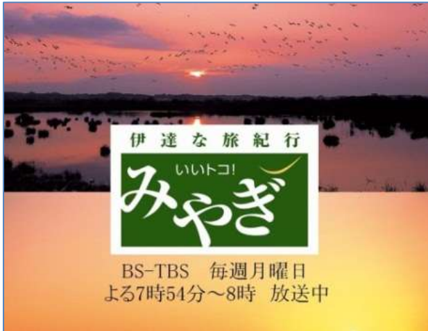
(広告画像のイメージ)