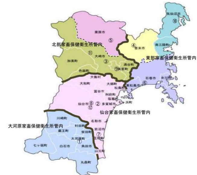
XVI 宮城県畜産関係行政機関一覧

地方機関（地方振興事務所、農業改良普及センター、家畜保健衛生所、畜産試験場など）