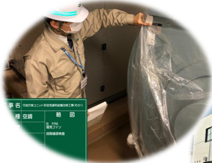
(改修工事の監督員)