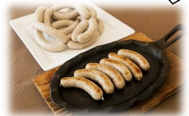
作ったウインナーはお持ち帰りいただけます

【使用する材料】 豚肉（宮城県産）、羊腸、 香辛料＜食塩、砂糖、香辛料（小麦を含む）/リン酸塩（Na）、 調味料（アミノ酸）、 酸化防止剤（V.C）＞