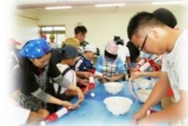
親子で仲良くクッキング♪

主 催 宮城県東部地方振興事務所登米地域事務所 お問い合わせ先 TEL：0220-22-6123 FAX：0220-22-8096 協 力 有限会社伊豆沼農産