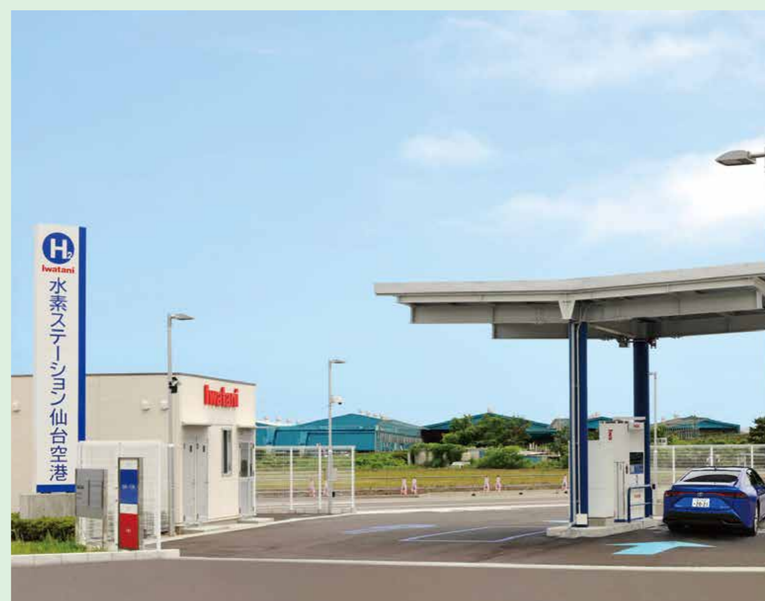
イワタニ水素ステーション仙台空港

そして令和3年8月、県内2基目の商用水素ステーションとして、「イワタニ水素ステーション仙台空港」が仙台空港の南西にオープンしました。この水素ステーションでは、「福島水素エネルギー研究フィールド (FH2R)」（福島県浪江町）で作られた再エネ由来の水素を供給することも検討されています。