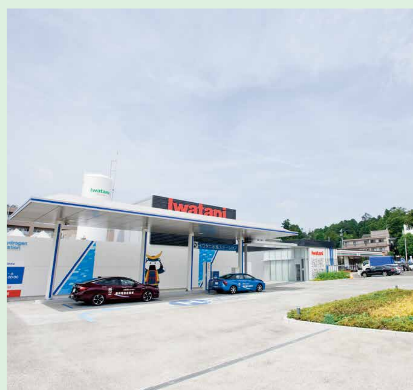
イワタニ水素ステーション宮城仙台