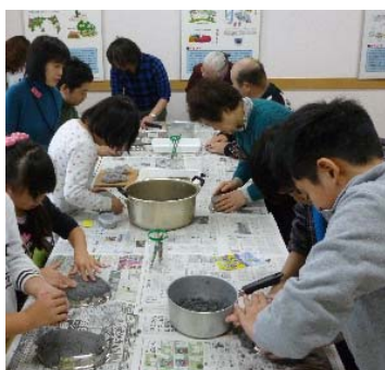
しばしの間、粘土に夢中

最後に、燃料電池自動車とスマート水素ステーションを見学しました。作製したカマ神様は古新聞で作ったバッグに入れて、各自持ち帰られました。