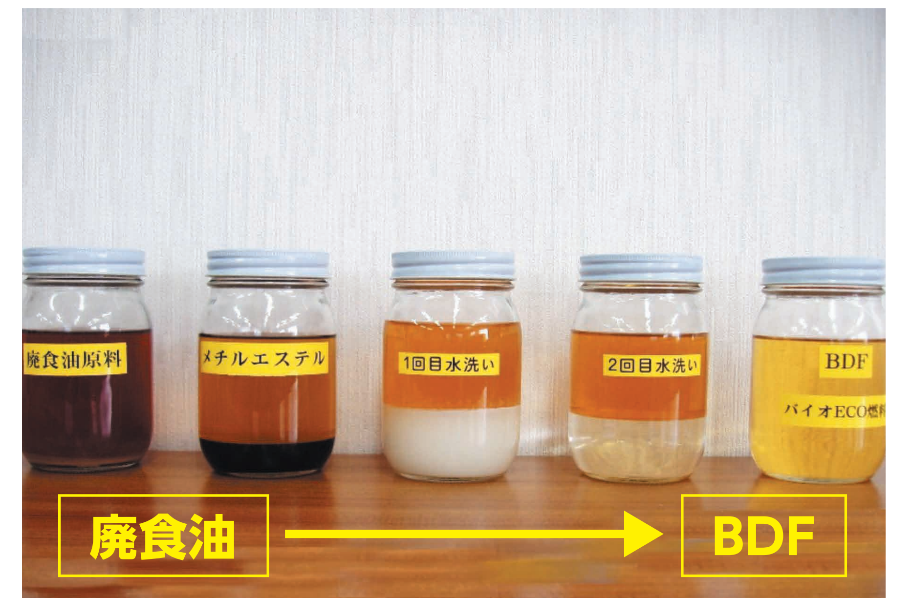
バイオディーゼル燃料が出来るまで