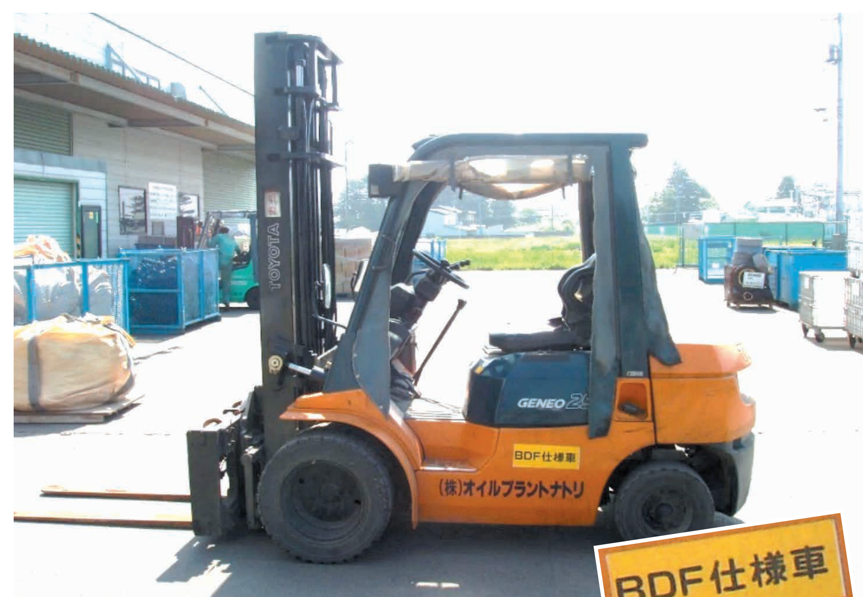
バイオディーゼル燃料 (BDF) で動くフォークリフト