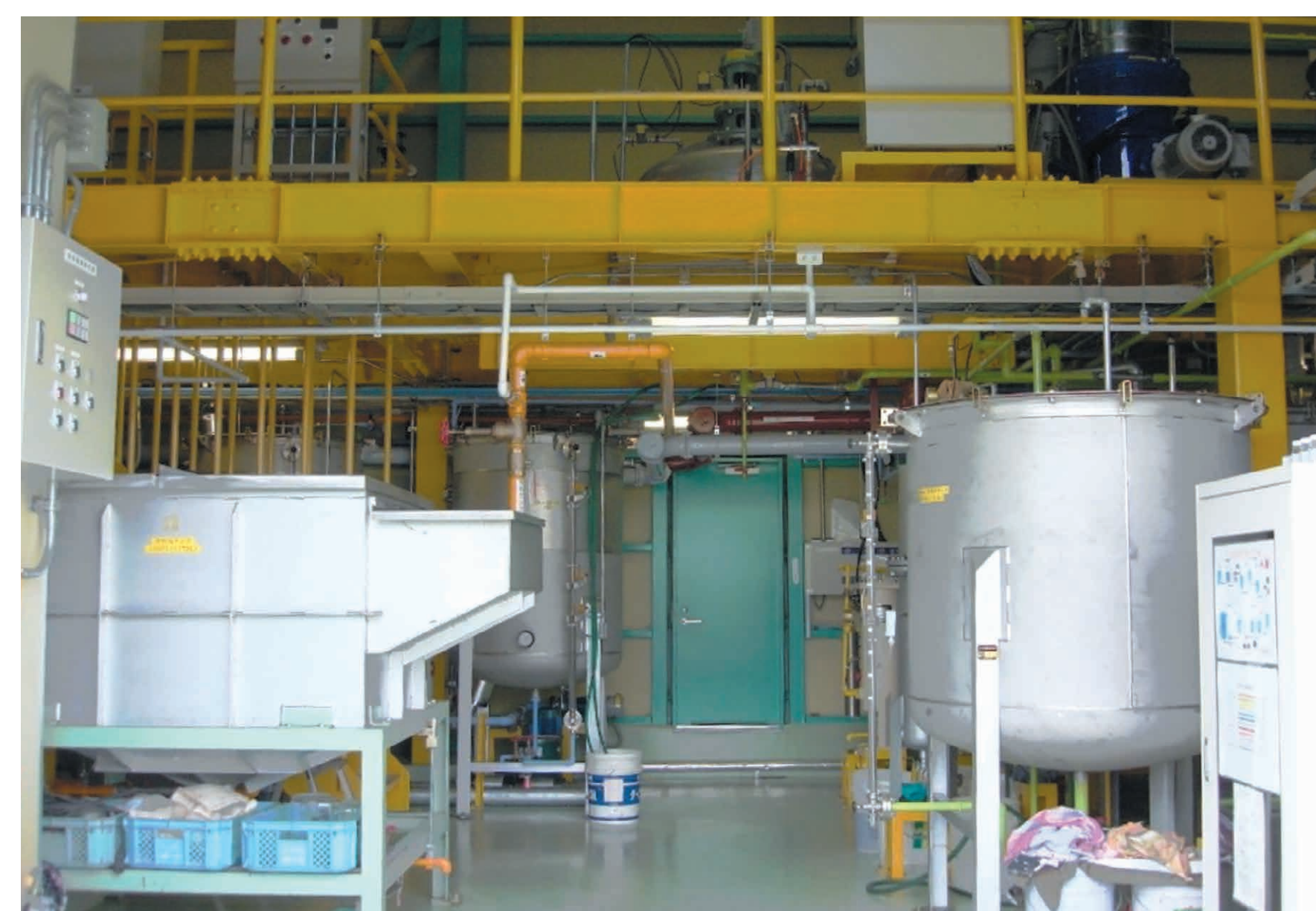
バイオディーゼル燃料精製施設