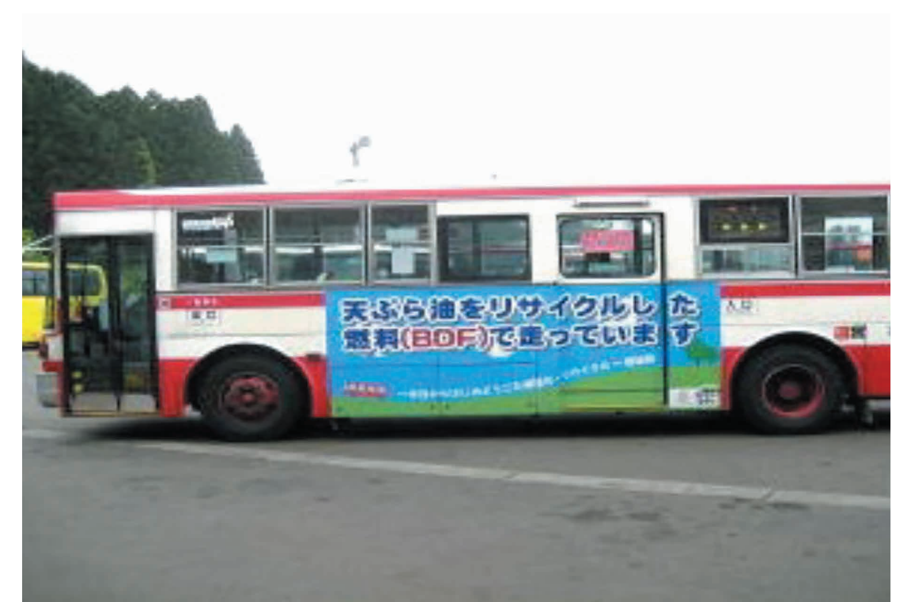
BDFで走行した宮城交通様のバス