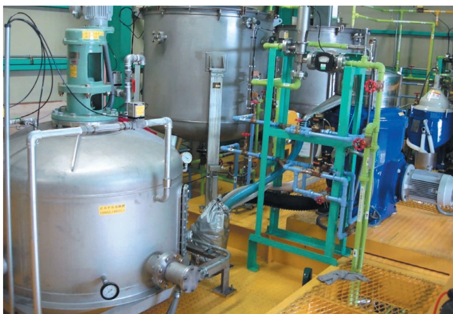
バイオディーゼル燃料精製施設