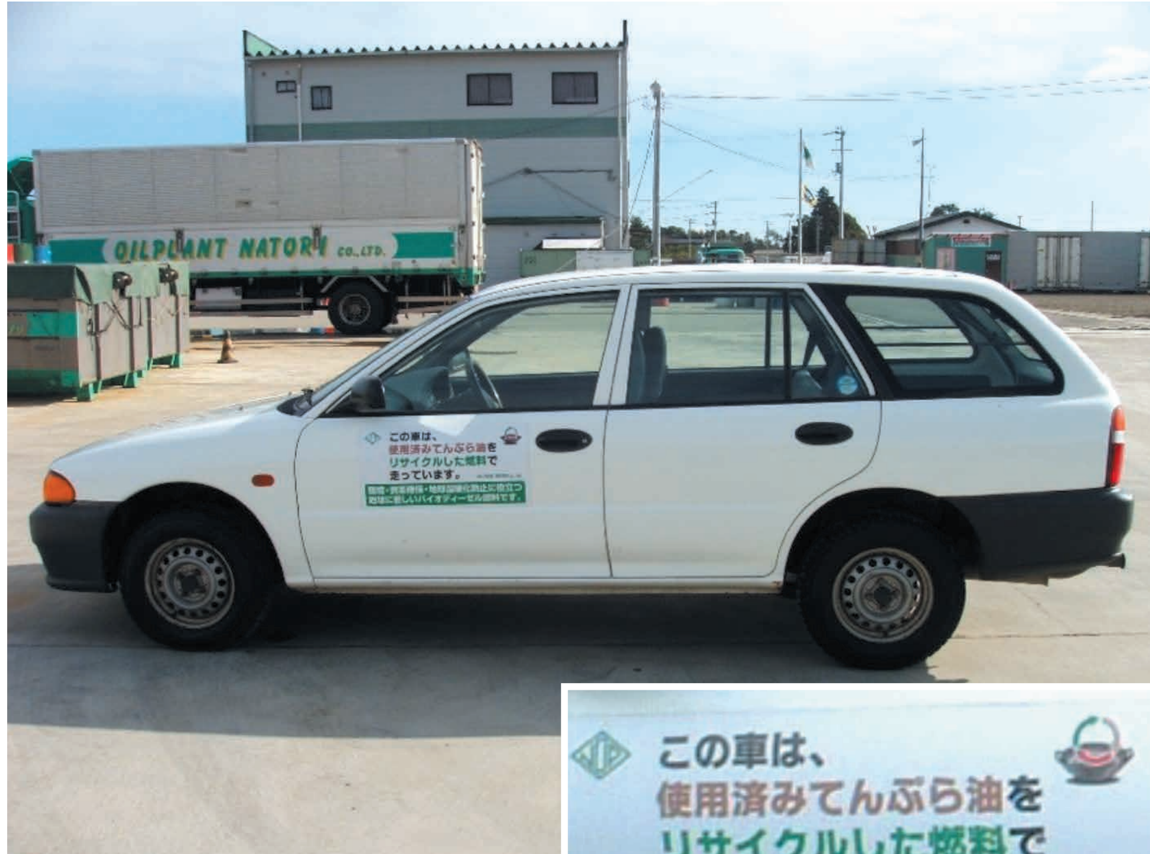
初めてバイオディーゼル燃料を利用した車

廃食油の回収によるBDF (バイオディーゼル燃料) の自社生産を行い、社用車等の燃料を軽油からBDFに転換。自社で廃食油の回収からBDFの製造・利用までを行っており、製造したBDFはこれまでに公共バスなどで活用されている。また、名取市が一般家庭からの廃食油を地域のスーパー等に集め、地域の社会福祉法人が回収、当該団体がBDFを製造し、BDFが地域で活用されるとい地域循環が生まれている。平成16年度からの取組であり、継続性に優れているほか、工場の消費電力を全てバイオ燃料由来の電力に置き換える計画を有するなど、今後の波及性・発展性も期待される。