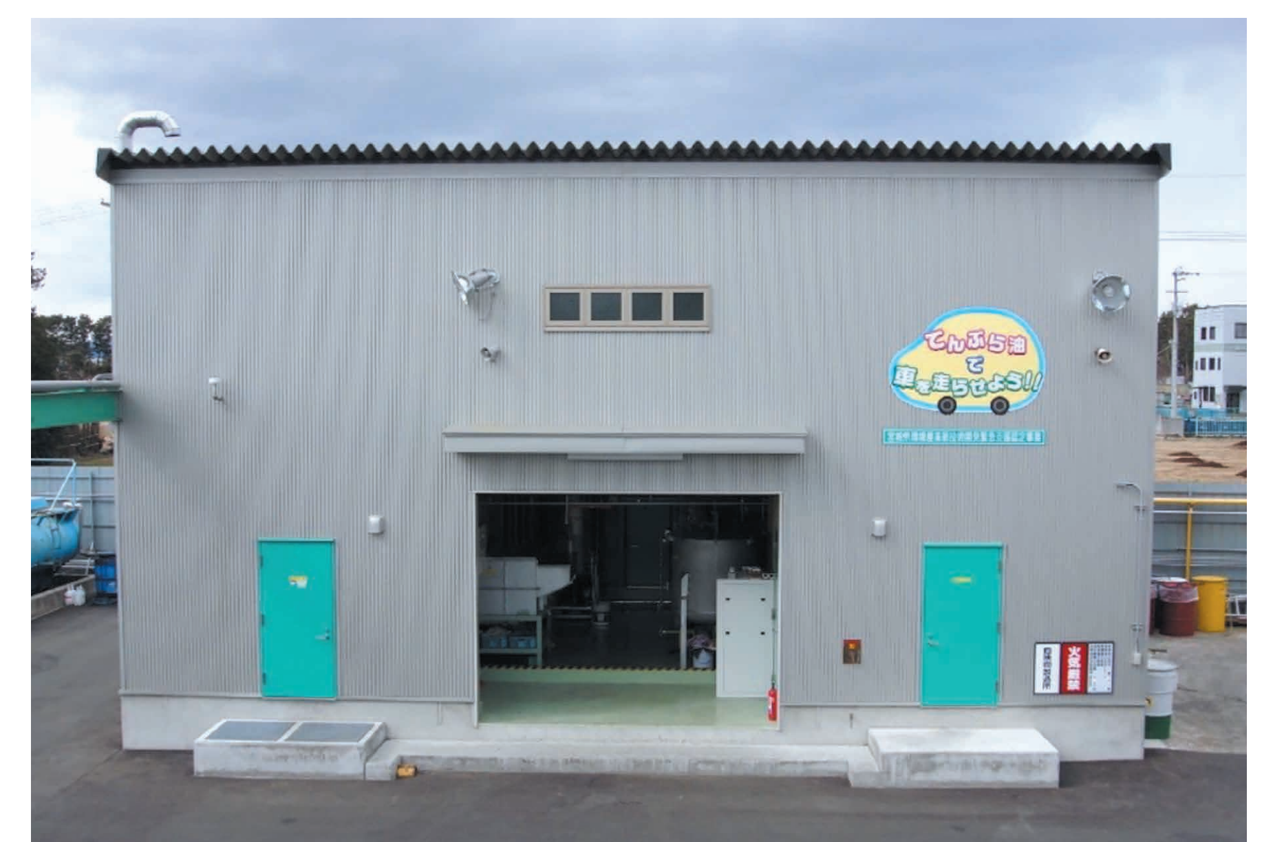
宮城県環境産業新技術開発 緊急支援認定事業施設