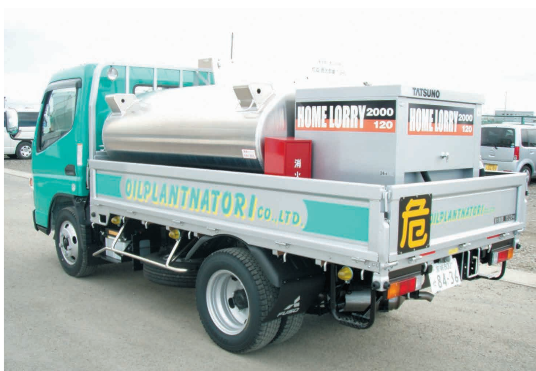
バイオディーゼル燃料 (BDF) で走行しBDFを配送するトラック