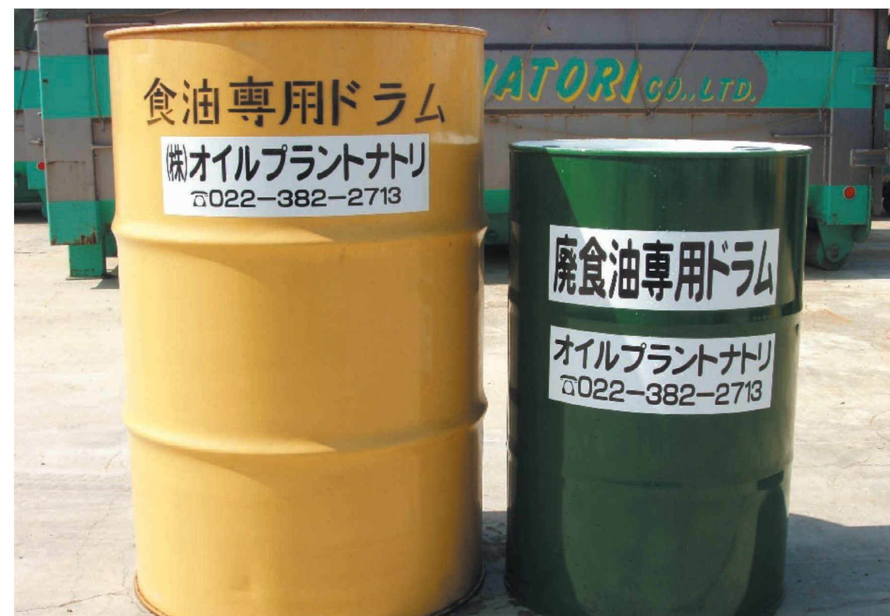
回収したてんぷら油