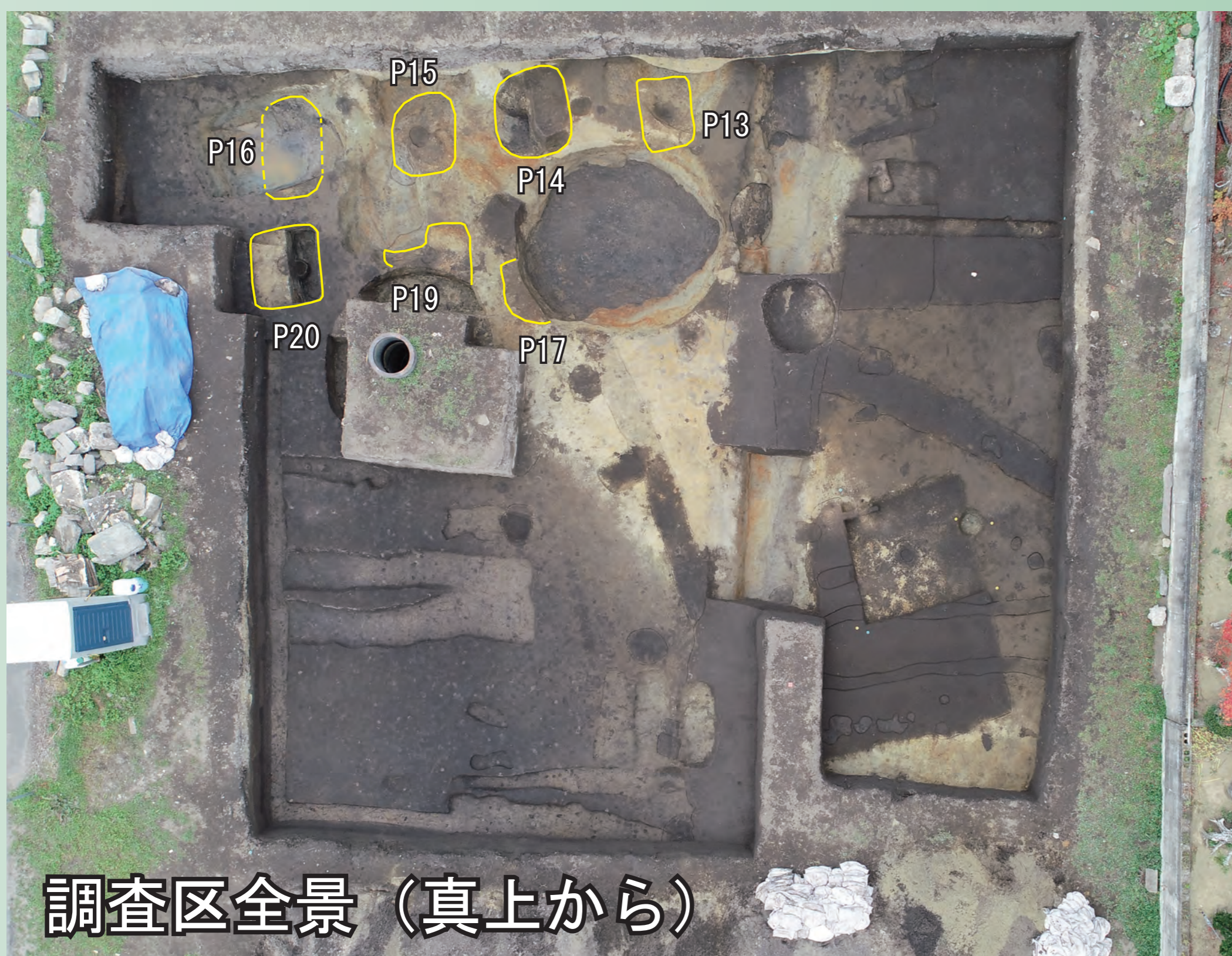
調査区全景（真上から）

柱を立てるために掘った穴の大きさは、長さ約140cmで、柱の大きさは直径約30cmです。柱材が残っていました。