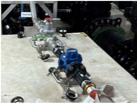
給水供給ユニットの設置