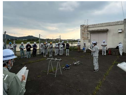
給水供給ユニットの説明

本訓練では緊急給水装置の仕組みを確認し、送水管本管からの分岐部分に減圧弁を設置後、給水ホースにて地上部に取り出し、給水ユニットまでの接続を行いました。装置設置完了後に、実際に蛇口を開けて給水の確認を行い、水質検査にて残留塩素等の検査を実施し、水質確認を行いました。今後も、緊急の要請に迅速に対応できるよう、技術の向上に努めてまいります。