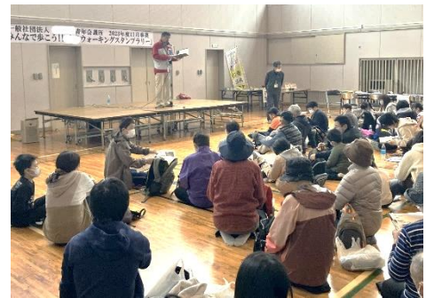
▲ウォーキングスタンプラリー開始前指導