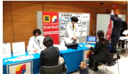
▲みやぎ健康 3.15.0 フェアへのブース出展