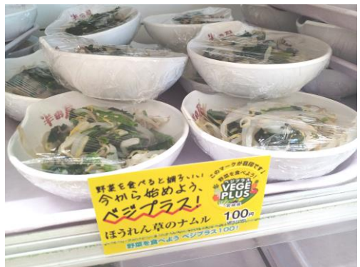
▲ベジプラスメニュー販売例