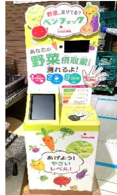
▲ベジチェックの設置