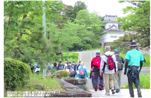
▲仙台青葉まつりウォーク