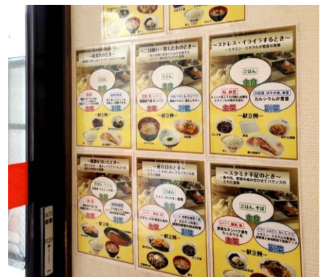
▲3月食べ合わせ例(西多賀)