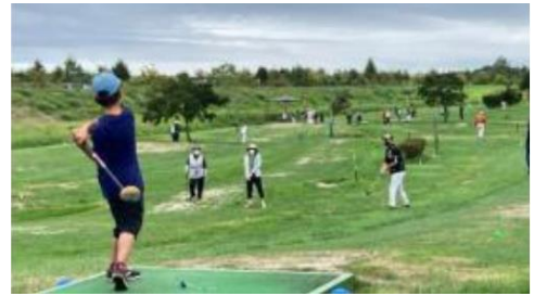
▲パークゴルフ健康イベント