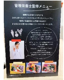
▲スマートミール弁当