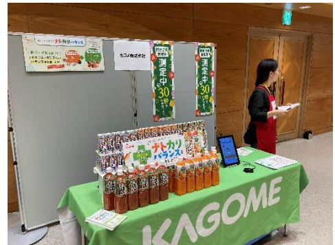
▲みやぎ健康 3.15.0 フェア