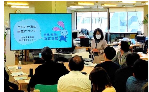
▲がん教育(企業事業所)