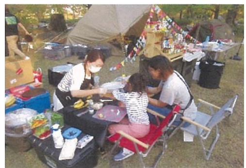
▲七木田公園キャンプイベント出張教室 親子青空生春巻き教室