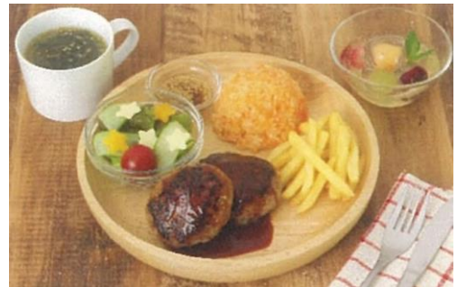
▲春休み親子料理教室