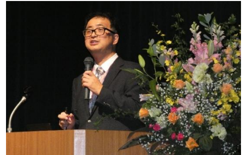
▲がん講演会(仙台市福祉プラザ)