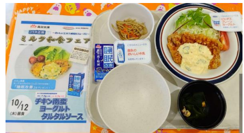
▲事業所食堂でのコラボフェア