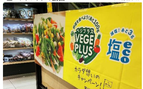
▼ベジプラス広報活動