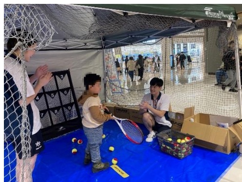
▲「イオンモール新利府 南館」でのイベント