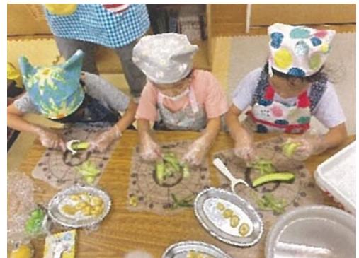
▲野菜を食べよう！夏休み生春巻きづくり教室