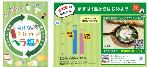
▲リーフレット、メニューPOP