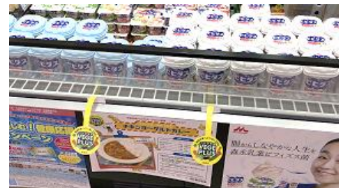
▲みやぎ生協でのコラボ売場