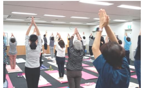
▲いきいき健康フィットネス

※ベジチェック:手を載せることで血中のカロテン濃度を計測し野菜摂取量を簡易的に計測できるもの。