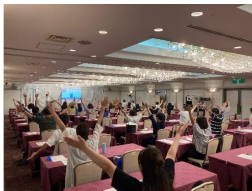
▲睡眠の質を高めるセミナー