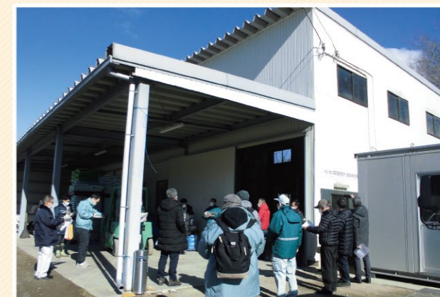
整備地区の担い手を対象とした視察研修

農地整備事業区内での担い手への農地集積と経営の高度化を図るため、市町村や関係機関と連携し、土地利用調整や担い手の経営と技術の向上に資する研修活動を支援しています。