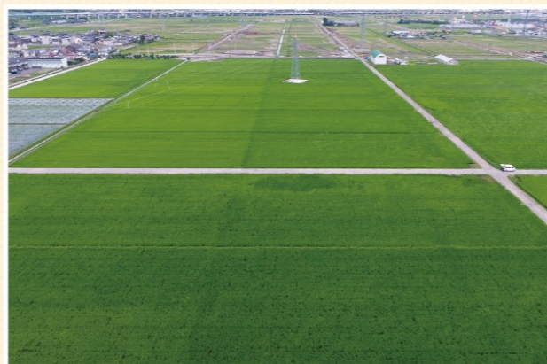
整備後ほ場での水稲栽培