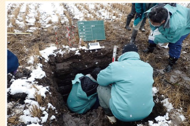
整備予定農地の土壌調査

農地整備の実施を希望する地域の将来的な農業ビジョンや担い手への農地集積を含む営農計画の策定を支援し、整備予定地の現状を把握するための各種調査や整備内容の設計等、農地整備事業の計画作成に取り組めます。