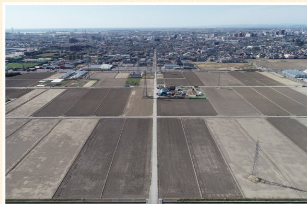
沿岸部の整備後ほ場