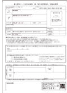
QRコード付交付申請書