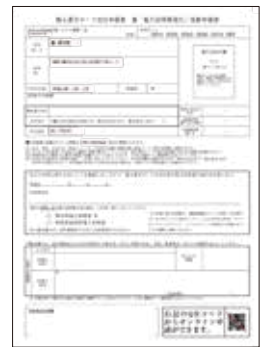
QRコード付交付申請書