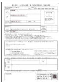
QRコード付交付申請書