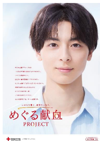
めぐる献血PROJECT ポスター