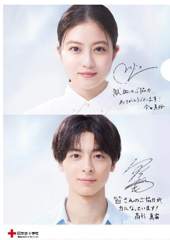
オリジナルクリアファイル