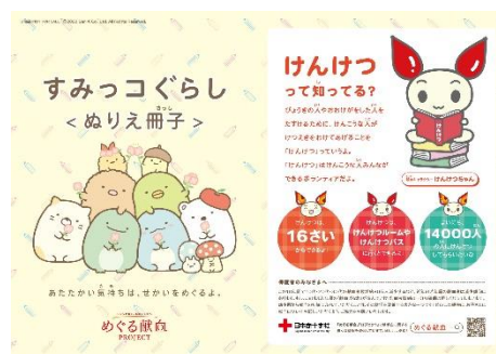
すみっこぐらしとコラボしたぬりえ冊子