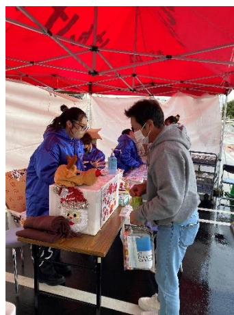
全国学生クリスマス献血キャンペーン風景