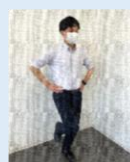
体力テストを 実施する