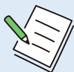
危険箇所の 洗い出し