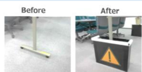
つまづきやすい 場所の見える化