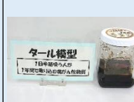
教材の展示で 啓発する