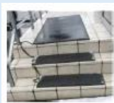
滑りやすい 箇所の対策