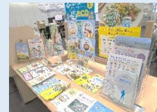
健康に関するパンフレット コーナーを設置する