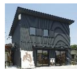
本社(精肉店兼加工センター)