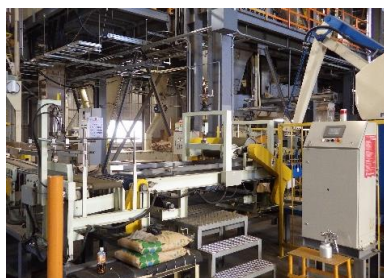
ペレット製造工場