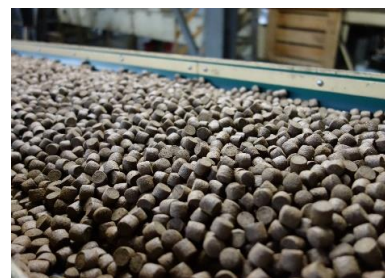
養殖ギンザケ用ペレット