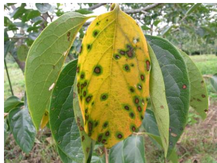
円星落葉病の秋の病斑