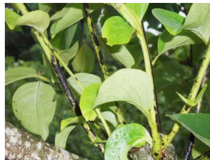
炭そ病の徒長枝病斑