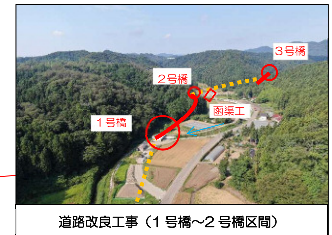
道路改良工事（1号橋～2号橋区間）