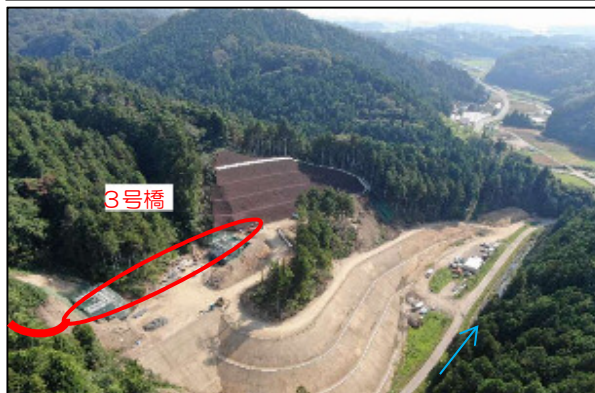
3号橋下部工・道路改良工事（2号橋～3号橋区間）