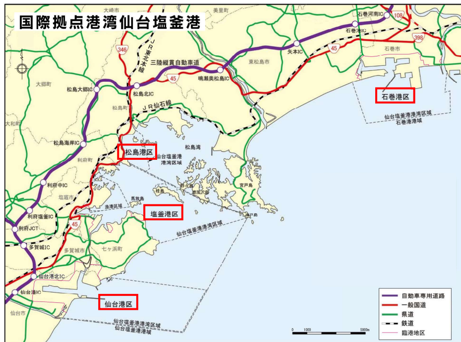
仙台塩釜港 位置図

仙台塩釜港は仙台湾に位置し、仙台港区、塩釜港区、石巻港区、松島港区の4つの港区からなる国際拠点港湾である。 東北管内港湾における全取扱貨物量の約3割 を占める 東北を代表する物流拠点 であり、東北唯一の製油所や油槽所、LNG基地、火力発電所等が立地する エネルギー供給拠点 となっている。