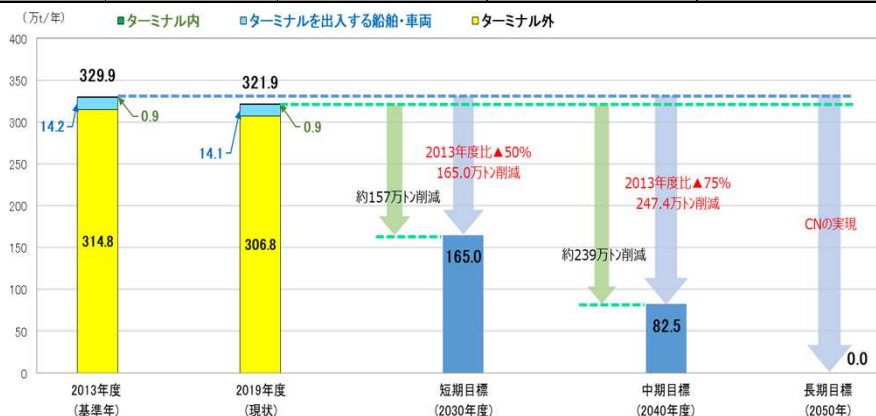
仙台塩釜港におけるCO 2 排出量の削減イメージ