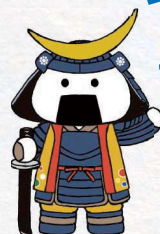
仙台・宮城 観光PRキャラクター むすび丸