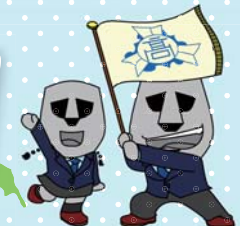
南三陸高等学校生徒制作 「みなみちゃん」と「さんりくん」 (モアイ)