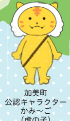
加美町 公認キャラクター かみ〜こ (虎の子)

学校と地域が 一丸となって これからの社会に 直結した 魅力ある教育活動を 実現します