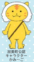
加美町公認 キャラクター かみ～こ

本校は、仙台駅から車で1時間ほどの、宮城県北西部に位置しており、校舎からは雄大な薬葉山や清らかな鳴瀬川を望むことができる自然豊かな学校です。「自主」「誠実」「協和」を校訓とし、地域から信頼され、地域社会の発展に貢献できる人材育成を目標に、地域と密着した活力あふれる学校を目指しています。