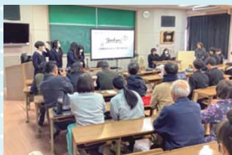
成果発表会（地域創造学）