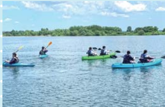
地域スポーツ学（カヌー体験）

加美町が学びのフィールドであり、まさしく「教室」です。ここでの学びを通して、本校と加美町、そして自分の未来を創造します。