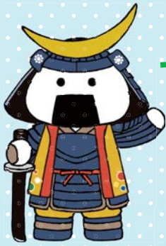
仙台・宮城 観光PRキャラクター むすび丸