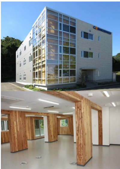
【事例1】株式会社コスモスウェブ（事務所） CLTパネル工法（ルート2） 県内初の3階建CLT建築