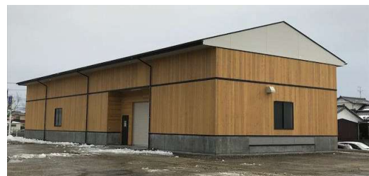
ユニット化した倉庫の開発