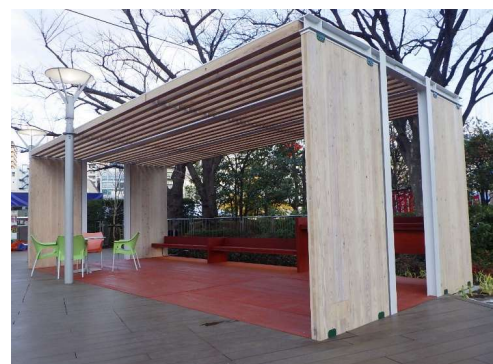
ユニット化した公園施設の開発