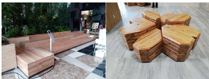
駅ファニチャーの開発