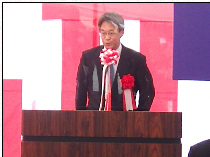
祝辞 中尾吉宏 仙台河川国道事務所長