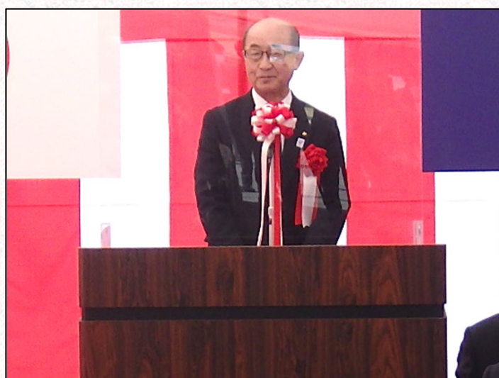
祝辞 遠藤信哉 宮城県副知事