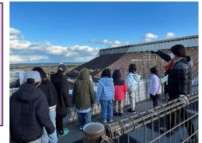
はまっこキッズ 震災遺構中浜小学校見学