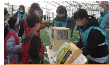
防災学習(公衆電話等使用体験)