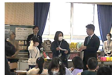
市長と懇談(公民館と連携)