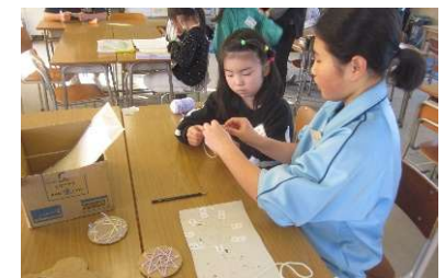
中学生との交流活動