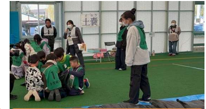
防災学習(土のうづくり体験)