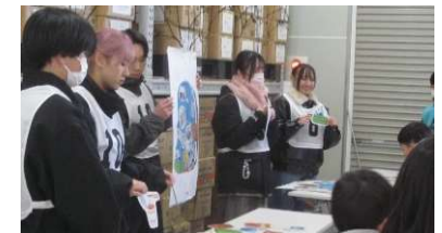
防災学習(防災倉庫見学)