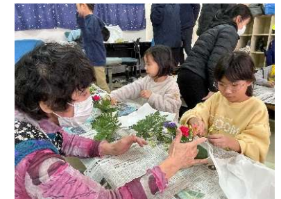
みやまっこクラブ 生け花体験