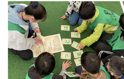
防災学習(防災脱出ゲーム)