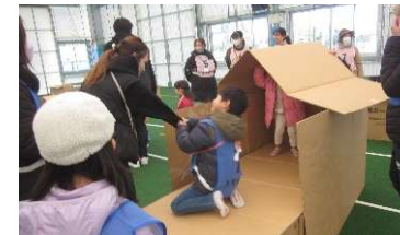
防災学習(段ボールベッド組立て体験)