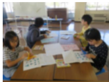
【丁寧に折ってみよう！】