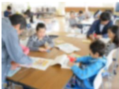
【講師から指導を受ける様子】