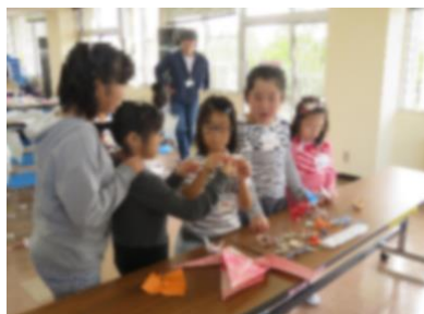
【いろいろなツルを折ってみたい】