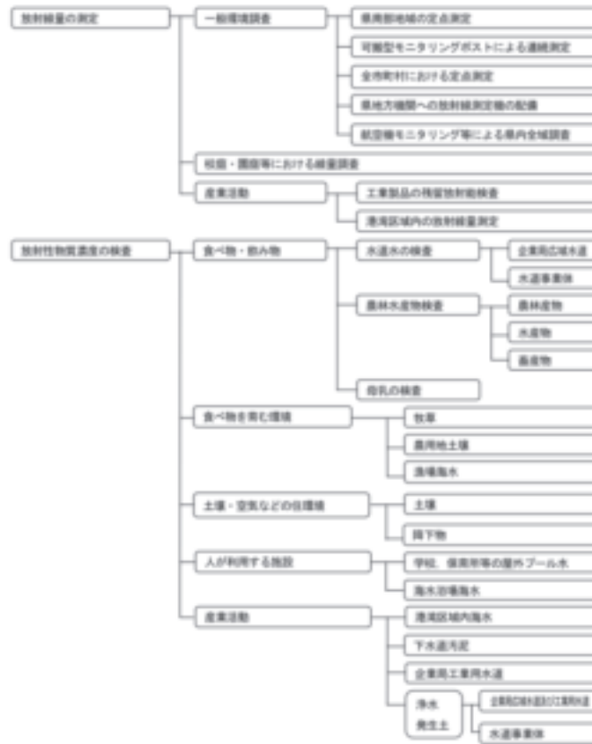
図表6-2-1 測定方針の体系