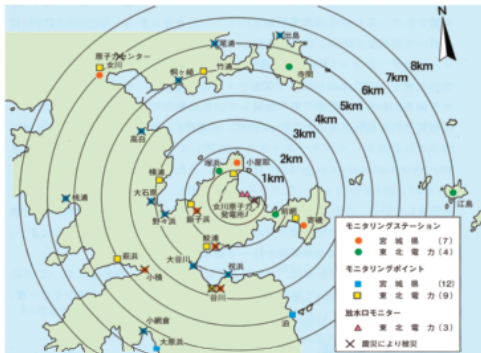
図表6-1-1 モニタリングステーション等設置地点と被災状況