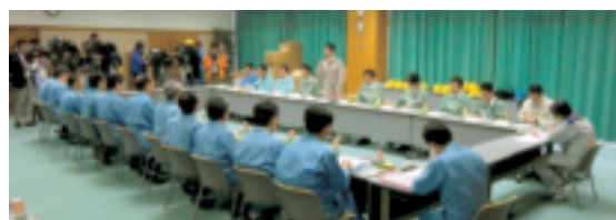
女川原発への立入調査