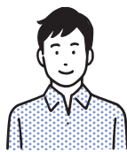
入社 6 年目 本吉響高校出身

気仙沼で働くなら水産業！と思い、チャレンジ精神で入社しました。今の業務では、フカヒレの様々な種類を知り、獲れる季節が別で、それぞれ特徴が違っているなど、何年たっても新たな発見があり、充実しています。原料から商品になるまで全部を見ることができるのがとても面白いです。また、業務で他社の人と話す機会もあり、視野が広がるのを感じています。やればやるほど、仕事の成果を実感しやすいと思います。