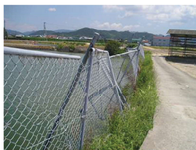
ため池における 破損した金網フェンス

ため池沿いなどに設置されている金網フェンスなどの安全施設において、破損や老朽化がみられた場合、当該箇所を補修することによって、ため池周辺の安全確保を図ります。