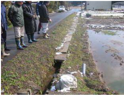
開水路の点検状況