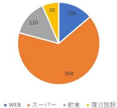
アンケート取得方法