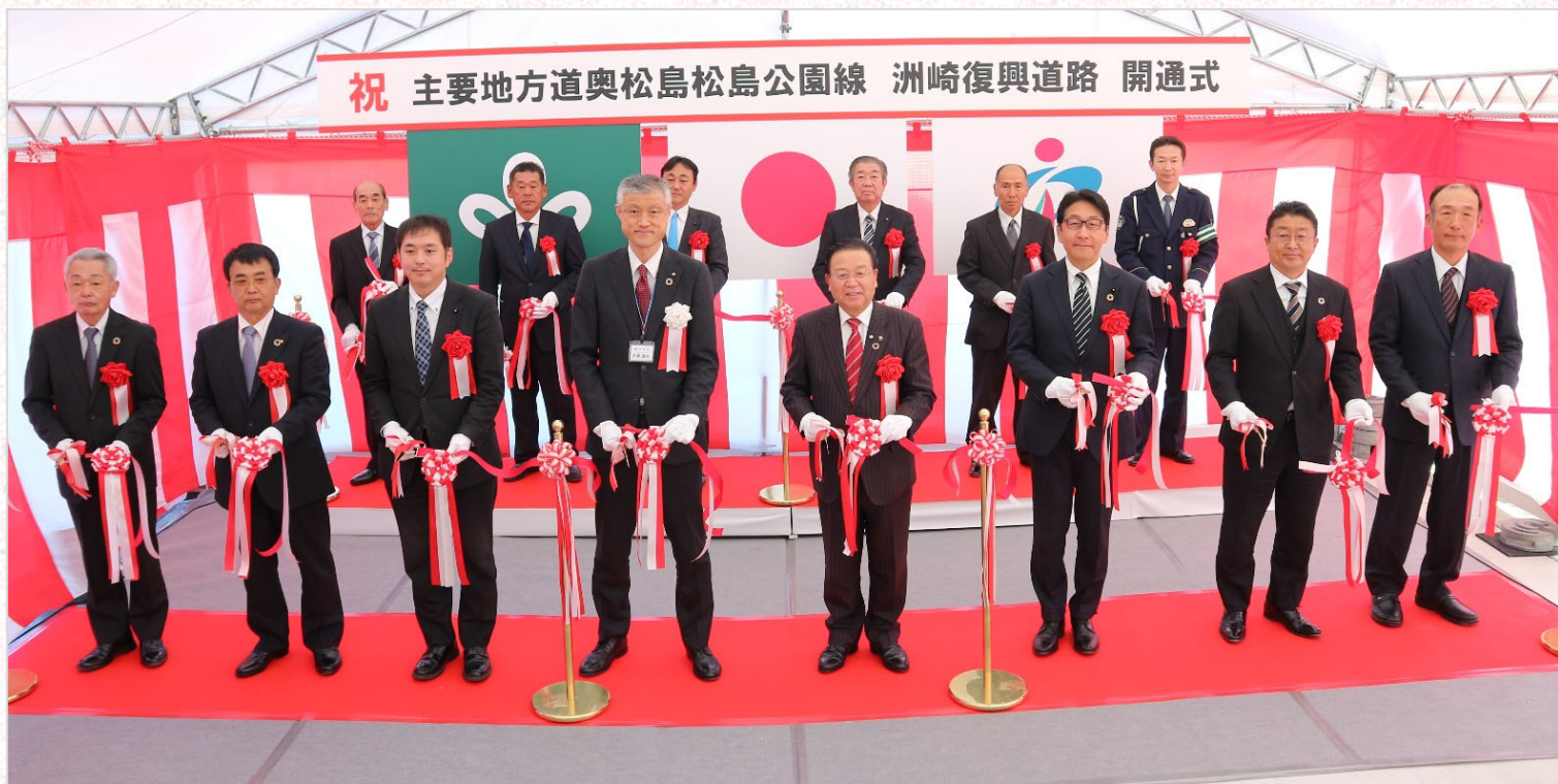
写真 テープカットの様子