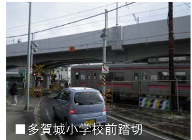
■多賀城小学校前踏切

平成24年4月8日(日)の始発から 上り列車・下り列車とも高架を運行することとなります